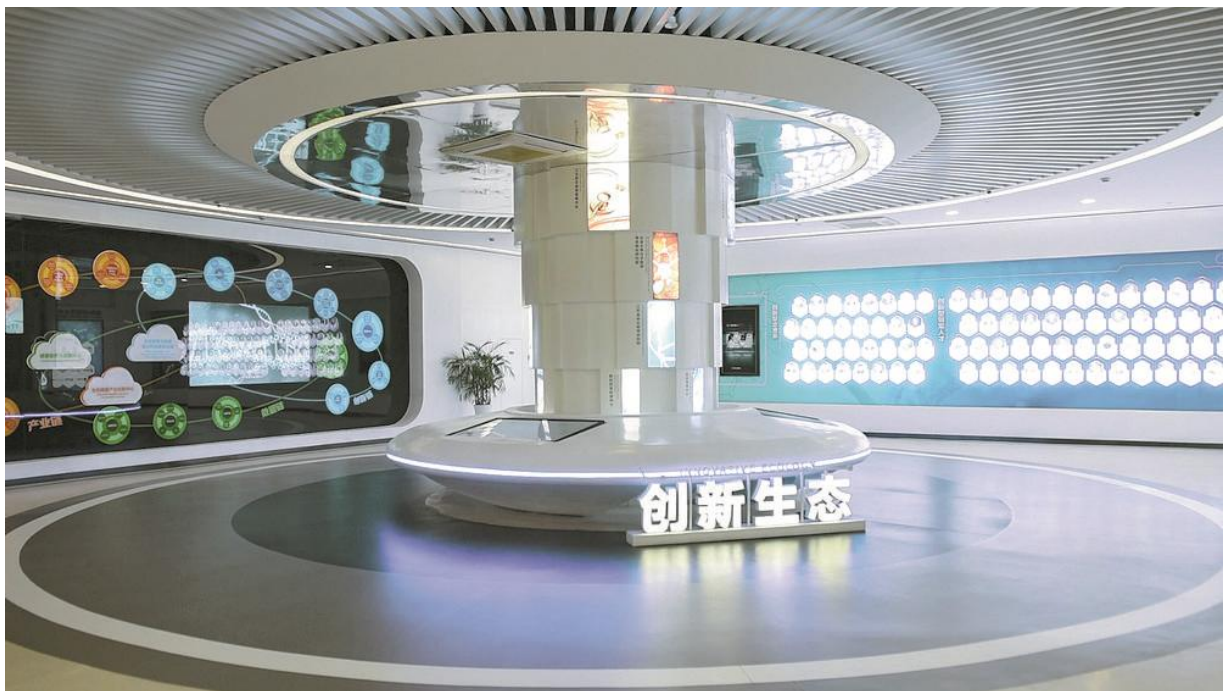
南京江北新区生物医药公共服务平台。