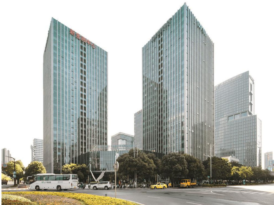
江苏自贸试验区南京片区载体腾飞大厦。