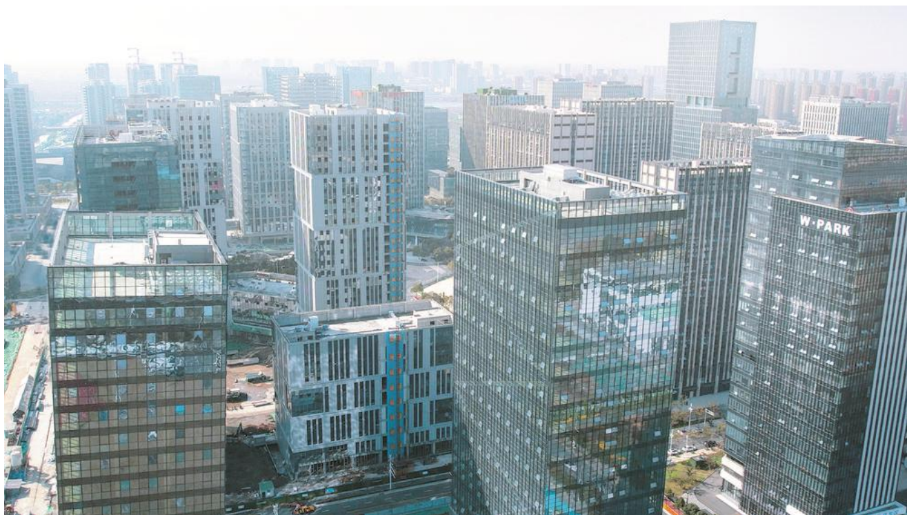
南京江北新区航拍。