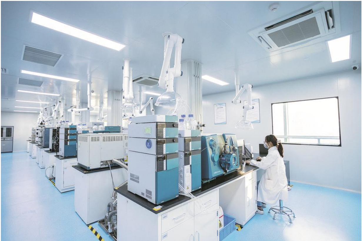
南京江北新区生物医药公共服务平台内，技术服务人员正在实验室内进行操作。